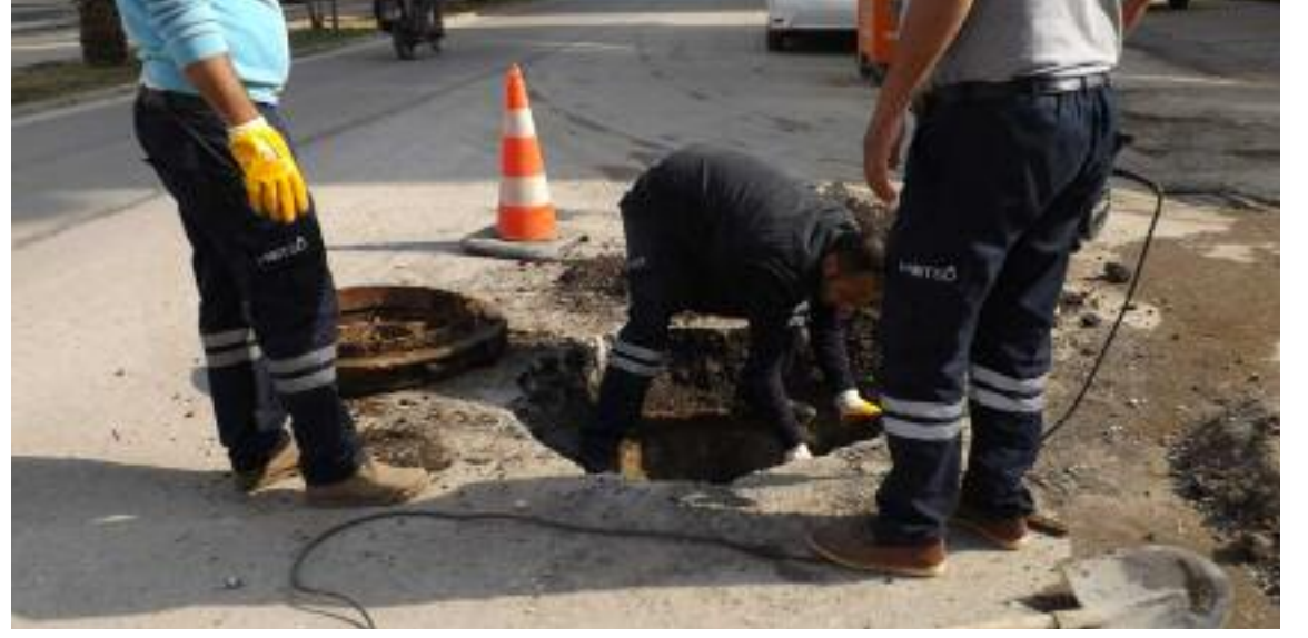
ATAYURT Haber Merkezi

Hatay Büyükşehir Belediyesi Su ve Kanalizasyon İdaresi Genel Müdürlüğü, kentin muhtelif noktalarındaki altyapı noktalarına bakım ve onarım çalışmalarını sürdürüyor.