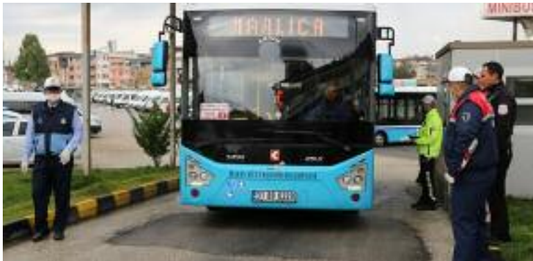
ATAYURT Haber Merkezi

Korona virüs (COVID-19) tehlikesine karşı tüm birimleri seferber olan ve vatandaşların sağlığı için her türlü önlemi alan Hatay Büyükşehir Belediyesi bu konudaki kararlı çalışmalarını sürdürüyor.