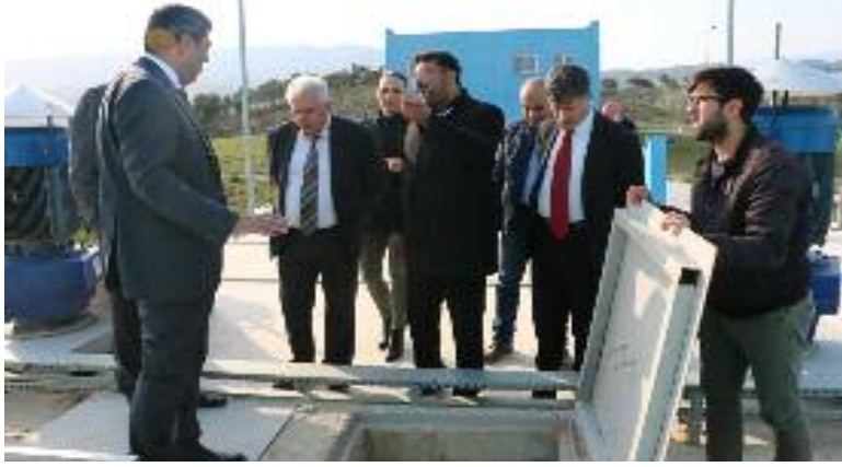
ATAYURT Haber Merkezi

Hatay Büyükşehir Belediyesi Su ve Kanalizasyon İdaresi Genel Müdürlüğü heyeti, Antakya,