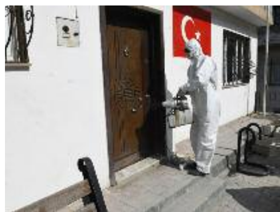
ATAYURT Haber Merkezi

Antakya Belediyesi ekipleri, ilçe genelinde bulunan muhtarlık binalarını da dezenfekte çalışması gerçekleştiriyor.